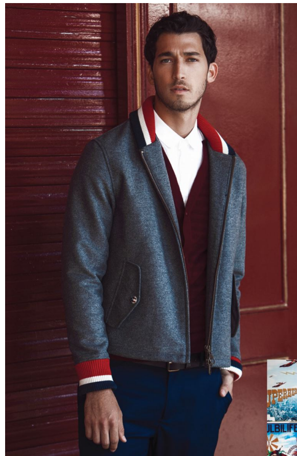
Esta página: Camisa, Dirk Bikkembergs. Chaqueta, Tenkey. Pantalón, Lacoste. Abrigo, Barbour.