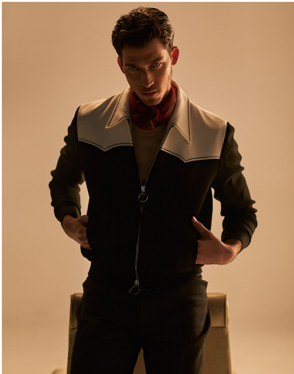
Página anterior: Camisa, Adolfo Dominguez. Chaqueta, Gant. Pantalón, Guess. Calcetines, Tenkey. Zapatos, Fluchos.