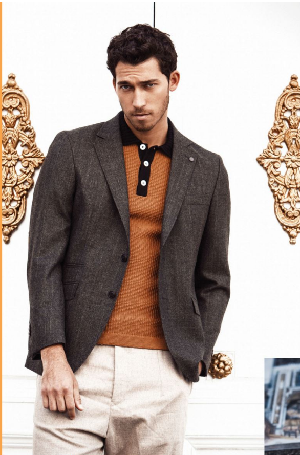
Esta página: Playera polo, Raf Simons para Fred Perry. Pantalón, Adolfo Domínguez. Blazer, Forecast.